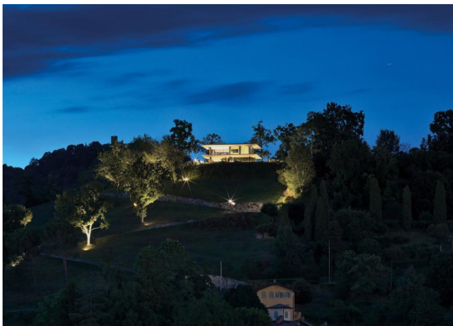
Federico Delrosso Architects | Teca House si colloca sulla sommità di una collina del biellese | © Matteo Piazza

Il progetto consiste nel recupero di un piccolo fabbricato rustico , collocato tra le colline delbiellese, del quale vengono mantenute le radici e i segni del passato agricolo, smaterializzandolo e attribuendogli una nuova funzione. Il rapporto tra passato e presente e tra "opera" e contesto viene bilanciato senza alterare gli equilibri dimensionali del luogo, andando altresì a esaltarne la valenza ambientale e divenendo punto di riferimento non solo culturale ma anche visivo.